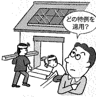
図表1 税額控除の種類

個人が、住宅の新築や購入又は増改築等を行った場合、一定の要件を満たす時には、五種類ある税額控除のいずれかを適用することによって、居住の用に供した年分以後の各年分の所得税額から一定金額を控除することができます。 ただし、どの税額控除を適用するか判断が難しいところがありますので、今回、ポイントを整理してみます。