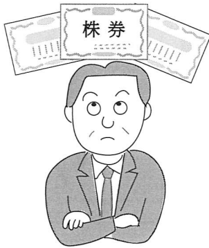
図1 個人・発行法人以外の法人に対する非上場株式の譲渡

例えば、時価が3000万円の子会社株を5000万円で売却した場合、売却額と時価との差額の2000万円は、買主から売主への贈与となります（次頁表参照）。